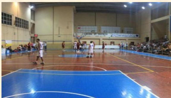
Lo Sport...per crescere bene!